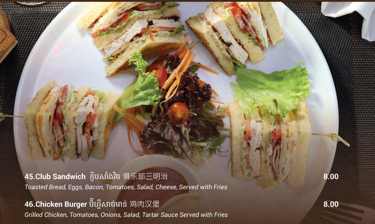
45.Club Sandwich ក្លឹបសំរាំងរិច 俱乐部三明治 Toasted Bread, Eggs, Bacon, Tomatoes, Salad, Cheese, Served with Fries