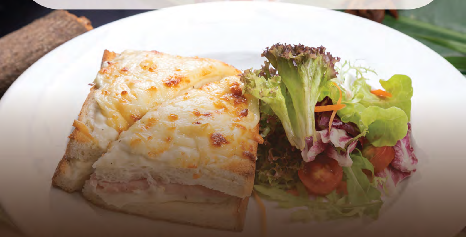
44.Ham & Cheese Sandwich សំរាំងរិចហោម និងឈើស Toasted Bread with Cheese, Ham and Side Salad