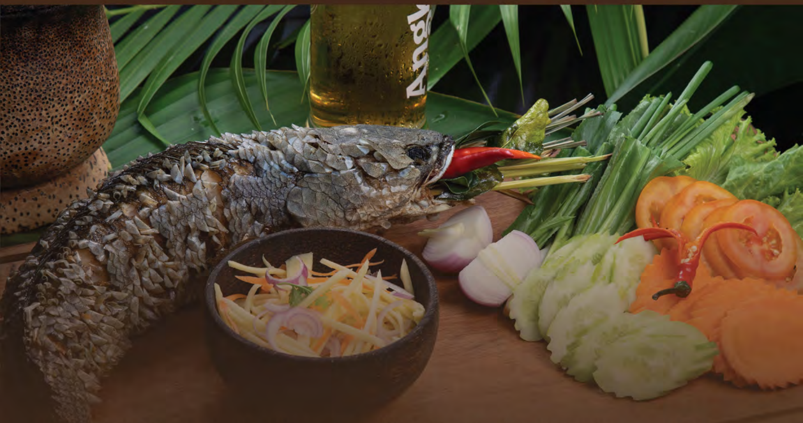
29. Deep-Fried River Fish with a Mango Sauce ត្រីបំពងជ្រូកស្វាយ 酥炸河鱼和芒果酱 Choice of Sweet & Sour / Sour Mango Salad