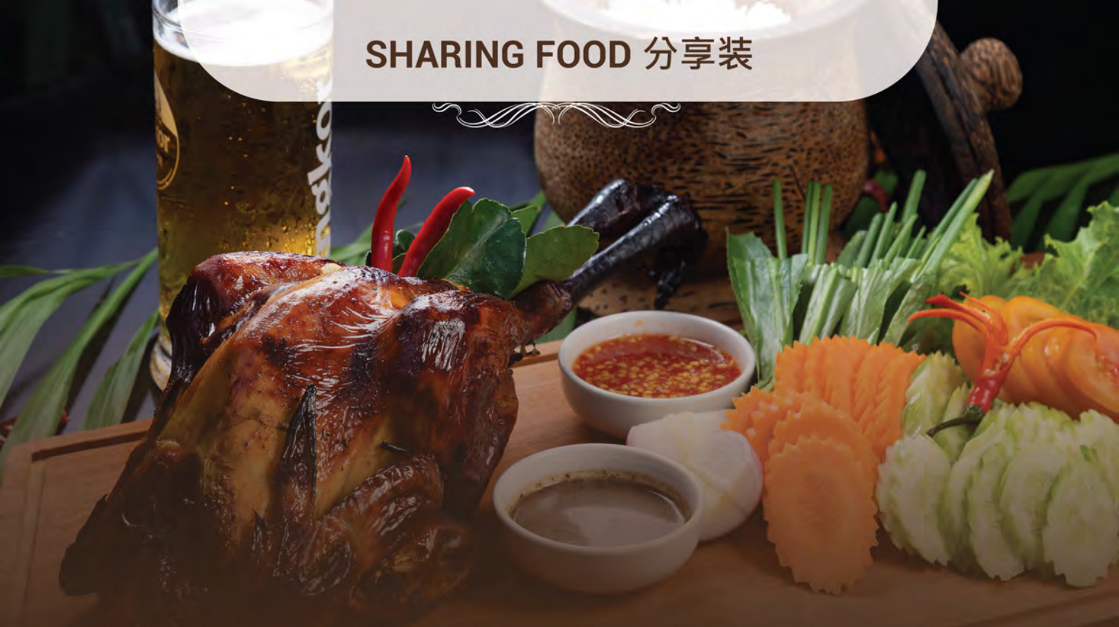
28. Grilled Whole Khmer Chicken មាន់ដុត 柬式整鸡烧烤 · 配生蔬菜与柬式酱料 Served with Raw Vegetables and Khmer Sauce Choice of Coca Cola / Honey / Spicy Salt